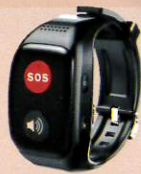
家中有市話機種 家中無市話機種 4G定位求救手錶 ※依據案家環境狀況擇一安裝